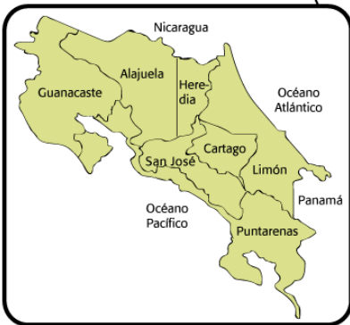
Mapa de Costa Rica